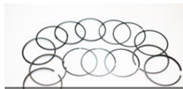
採用類金剛石碳(DLC)納米塗層的活塞環。 DLC-coated piston ring.

HKPC is now testing the coating function of the system on various types of precious metal products and watch parts and will share and promote the knowledge and application of Atomic Layer Deposition through seminars to local surface finishing industry.