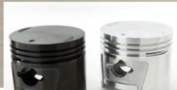
汽缸樣本使用 DLC 塗層後(圖左)，實用又美觀。 After using DLC coating, engine piston sample becomes more durable and visually appealing.

Turning ordinary into extraordinary with advanced surface technologies