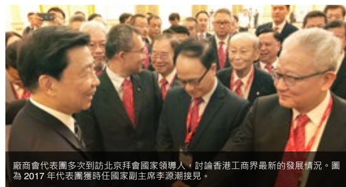
廠商會代表團多次到訪北京拜會國家領導人，討論香港工商界最新的發展情況。圖為 2017 年代表團獲時任國家副主席李源潮接見。