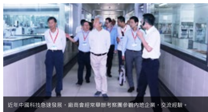
近年中國科技急速發展，廠商會經常舉辦考察團參觀內地企業，交流經驗。