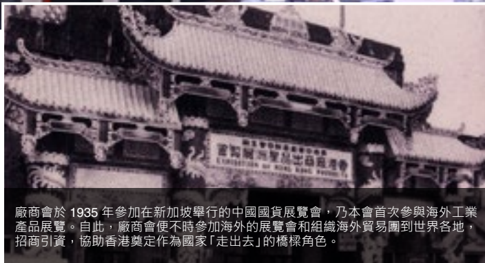
廠商會於 1935 年參加在新加坡舉行的中國國貨展覽會，乃本會首次參與海外工業產品展覽。自此，廠商會便不時參加海外的展覽會和組織海外貿易團到世界各地，招商引資，協助香港奠定作為國家「走出去」的橋樑角色。