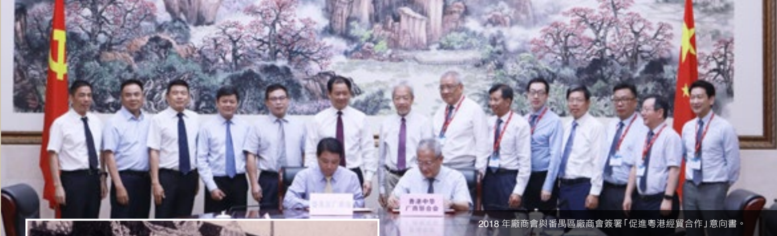
2018 年廠商會與番禺區廠商會簽署「促進粵港經貿合作」意向書。