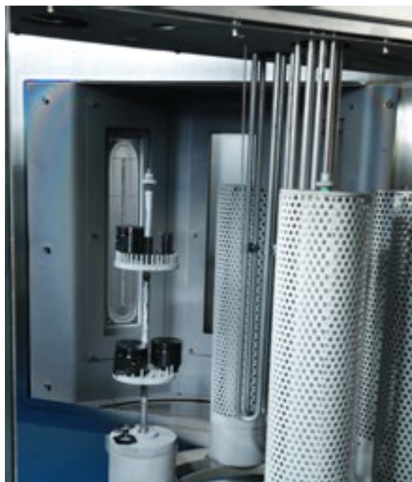
由生產力局研發的類金剛石納米塗層示範設備,使用「直流-交流電源疊加偏置技術」加強熱應力控制,提升塗層的密度、附著力和硬度。

生產力局在創新及科技基金的資助下,開發了類金剛石納米塗層,附著力和硬度比一般 DLC 塗層更高,適用於汽車零部件的表面,以提升汽車零部件的效率和耐久性,有效減少汽車碳排放。