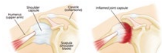
圖 1: 左: 正常肩關節, 右: 肩週炎肩部

五十肩 ，有多個名字，又名「肩周炎」、「凍結肩」、「冰凍肩」(Frozen Shoulder)，因發病者多於五十至六十歲之間，故亦被坊間多稱呼為「五十肩」，正確學名為粘黏性關節囊炎 (adhesive capsulitis) (圖 1)，由於關節囊是軟組織，因此，X光亦難以反映出來，患者如感到肩部不適，應及早接受臨床診斷，以免病程延誤。