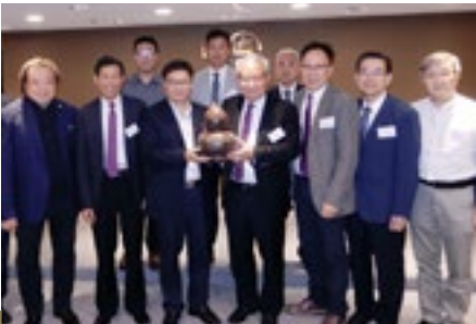
廣西欽州市委統戰部代表團訪會

廣西自治區黨委常委、統戰部部長徐紹川 (前排左五) 率領代表團一行 8 人，於 6 月 4 日蒞會訪問，由本會吳宏斌會長 (前排右五)、史立德第一副會長 (前排右四) 及黃震副會長 (前排左四) 等出席接待。