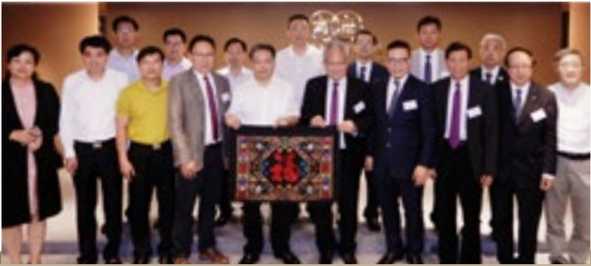
廣西壯族自治區百色市代表團訪會

廣西壯族自治區政協副主席、百色市委書記、市人大常委会主任彭曉春 (前排左五) 率領代表團一行 9 人，於 6 月 4 日蒞會訪問，由本會吳宏斌會長 (前排右五)、史立德第一副會長 (前排右四) 及黃震副會長 (前排右三) 等出席接待。