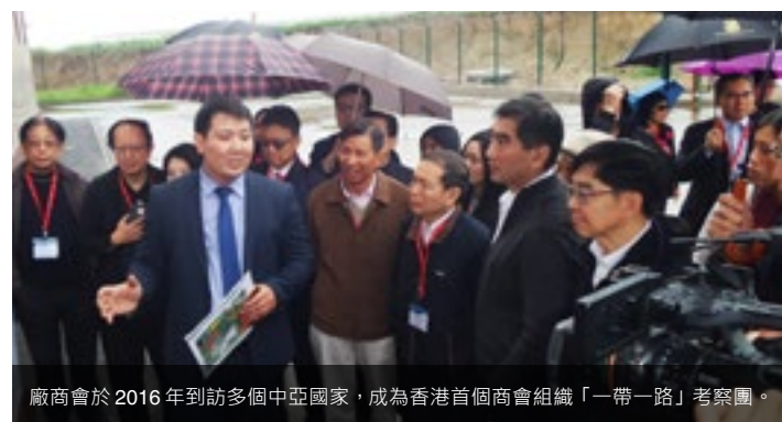
廠商會於 2016 年到訪多個中亞國家，成為香港首個商會組織「一帶一路」考察團。

On the other hand, the CMA will be the title sponsor of HKTVB Jade's program "40 Years of Reform and Opening Up in China". The production of the Jade News and Information Division reviews the reform and opening up journey from the economic, livelihood and policy perspectives; industries is one of the topics studied. The program is scheduled to be shown for 10 consecutive Sundays from 7pm to 7:30pm starting late September.