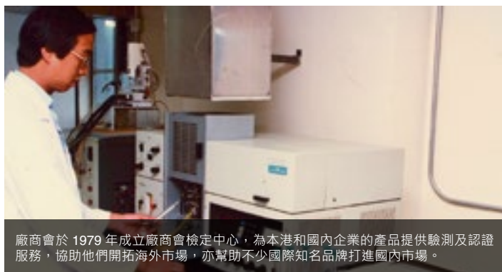
廠商會於 1979 年成立廠商會檢定中心，為本港和國內企業的產品提供檢測及認證服務，協助他們開拓海外市場，亦幫助不少國際知名品牌打進國內市場。

今年是國家改革開放 40 周年，當年上萬家港商率先到內地投資建廠，揭開了中國引進外資和興辦三資企業的序幕，為祖國發展帶來技術、人才和資金，自此，港資企業不但成為國家發展的強大推動力，更令珠三角地區成為世界工廠。